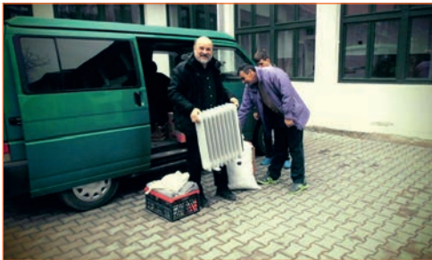
...Spenden auspacken im Szeklerneumarkt

Mit Medikamenten, Kleiderspenden und den traditionellen Süßigkeiten zu Ostern startete der Hilfstransport am 9.3. in Erfurt. Der grüne Transporter wurde richtig voll, die Ostermischbeutel mussten aus Platzgründen in Umzugskartons umgepackt werden. Die lange Fahrt nach Siebenbürgen verlief problemlos, obwohl es die ganze Zeit fast ununterbrochen geregnet hat. Verwundert war ich, als die rumänische Grenzkontrolle nach Unterlagen für die Ladung fragte. So etwas kam nicht mehr vor, seit Rumänien Mitglied der EU wurde. Der Beamte bat mich sogar, das Auto aufzumachen um den Inhalt zu kontrollieren. Die Weiterfahrt wurde dann doch noch genehmigt.